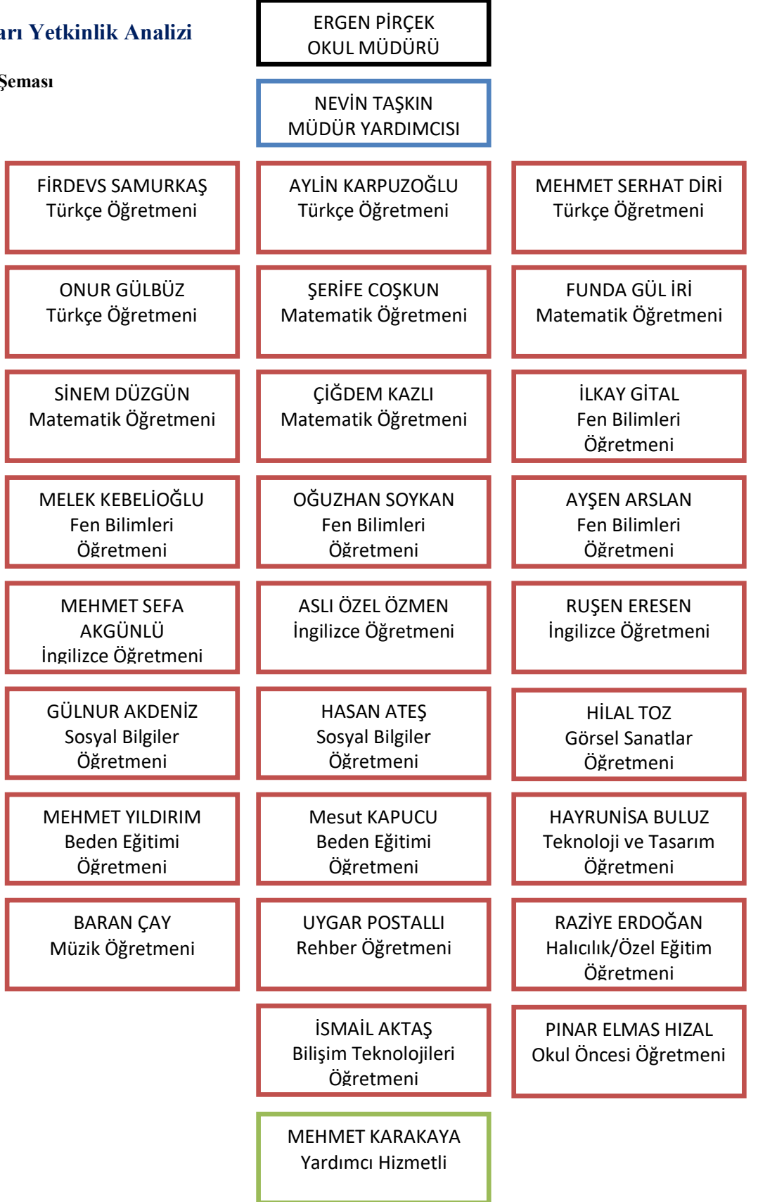
Şekil 2 : Teşkilat Şeması